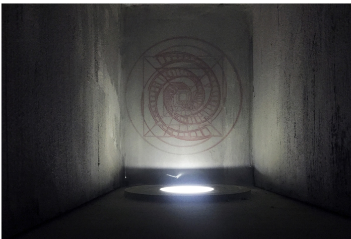
Cabinet Thermocline, d etail © Eleonor Kl ene