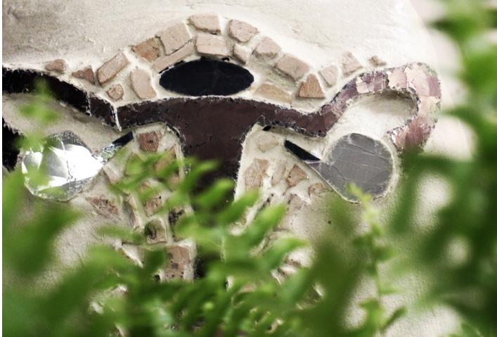
Isis et la Meute mixte, 2019, détail © Eleonor Klène